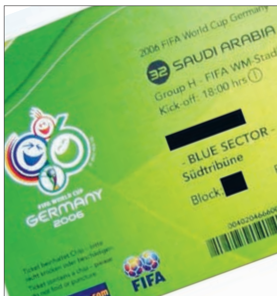
Цены. «Брама» продавала туры в 2 раза дешевле, чем все

► Турфирма собрала с болельщиков 300 тысяч евро. Денег нет, билетов нет, директор арестован